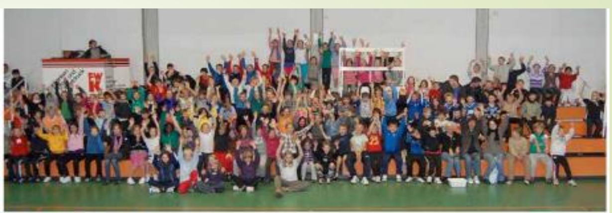
Jährliches Sportfest der 5. Klassen